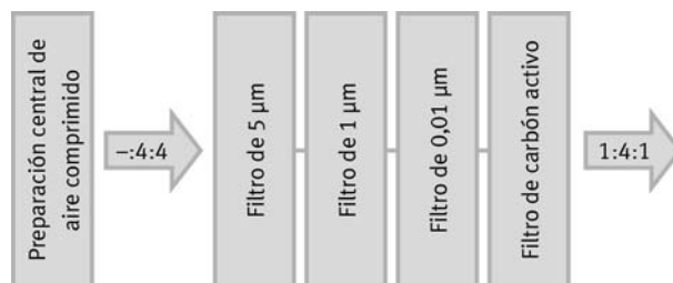
Cascada de filtración para obtener la clase 1:4:1